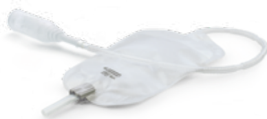
Conveen® Urine-opvangsysteem voor mannen