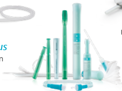
SpeediCath® Katheters voor zelfkatheterisatie