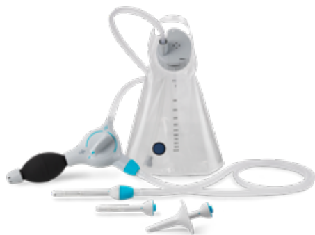
Peristeen® Plus Darmspoelsysteem